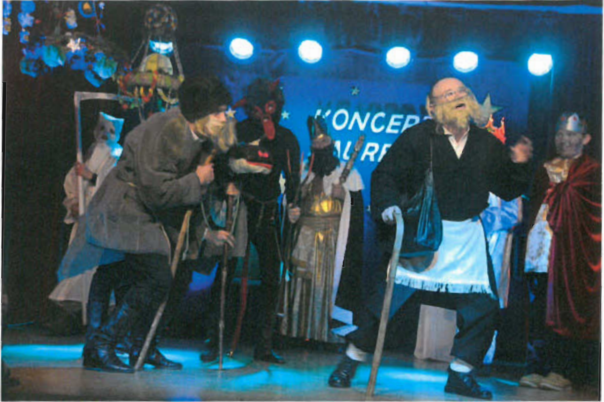
Fot. nr 17 Zespół Mszkieniczanie