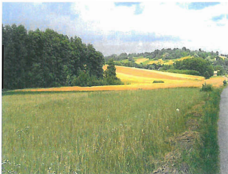
Fot. nr 2 Krajobraz wschodniej części sołectwa Jastew — wzniesienia o łagodnych stokach i spłaszczonych wierzchowinach.

Zachodnia krawędź wzniesienia jest bardziej stroma — tworzy ją wyraźny próg przechodzący w dno doliny rzeki Jastwianki. Wierzchowina wzniesienia jest płaska, jego kulminacja znajduje się poza opracowywanym terenem. Wschodnie wzniesienie ma podobny charakter.