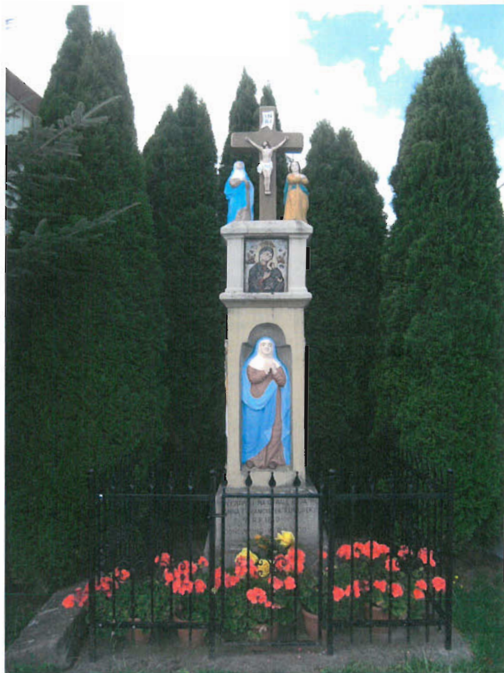
Fot. nr 5 Grupa Ukrzyżowania, 1860 rok