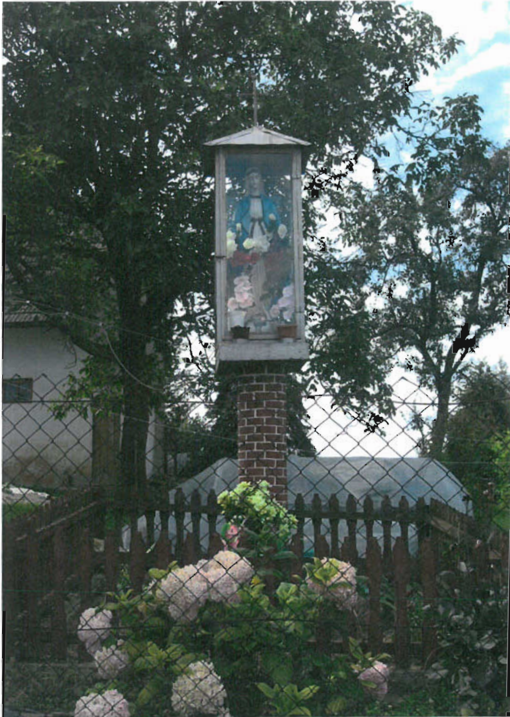
Fot. nr 8 Figura Matki Bożej, 2000 rok