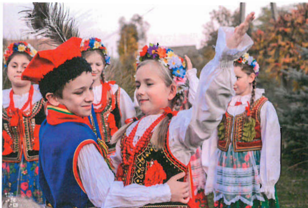
Fot. nr 15 Mali Łoniowiaci

zdobywali nagrody, m.in. „Krakowski Wianek” podczas Przeglądu Regionalnych Zespołów Ludowych w Szczurowej. Próby zespołu odbywają się w Łoniowej. Uczestniczy w nich około 40 osób, wśród których obok mieszkańców Łoniowej są także mieszkańcy Jaworska, Łysej Góry, Dębna, Woli Dębińskiej, Dołów i Porąbki Uszewskiej.