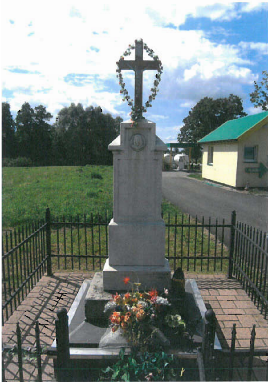
Fot. nr 3 Krzyż, datowanie nieznane,