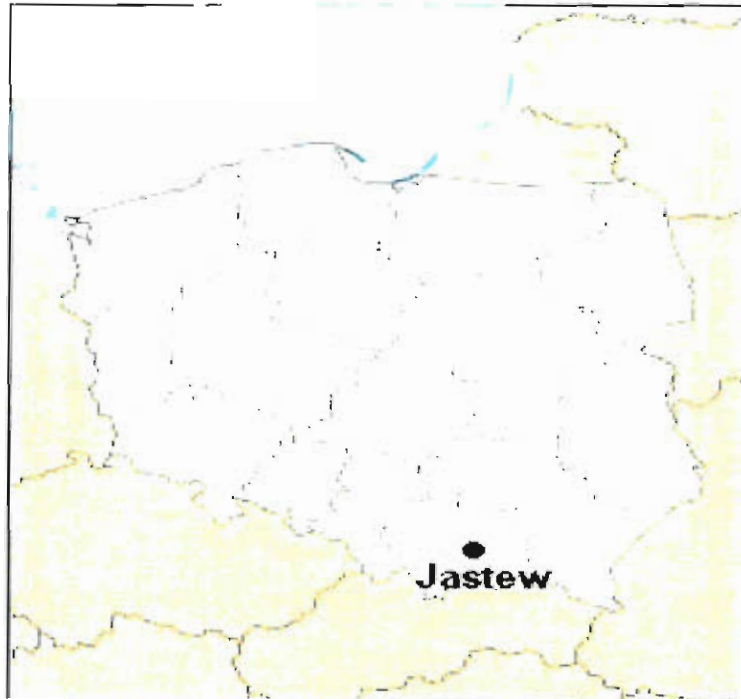
Rys. nr 1 Położenie miejscowości Jastew na mapie Polski

Wieś Jastew to jedno z trzynastu sołectw Gminy Dębno. Wieś położona jest w województwie małopolskim, powiecie brzeskim, w gminie Dębno.