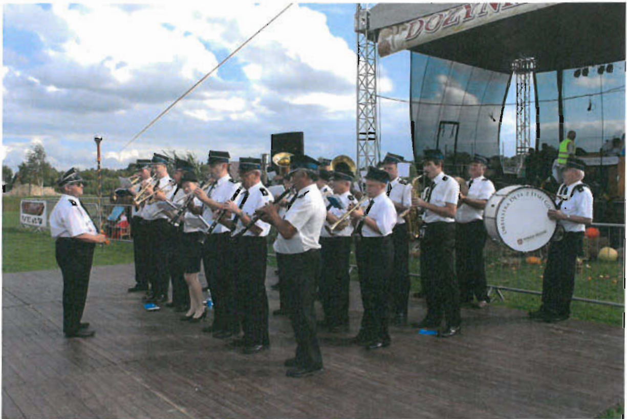
Fot. nr 12 Orkiestra Dęta OSP z Łysej Góry

nastąpiła fuzja orkiestry z miejscową strażą pożarną, z tego też powodu pojawiła się nowa nazwa: Orkiestra Dęta OSP w Łysej Górze .