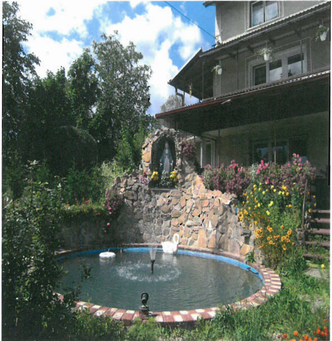
Fot. nr 6 Figura Matki Bożej, Grota Lourdes, 1999 rok