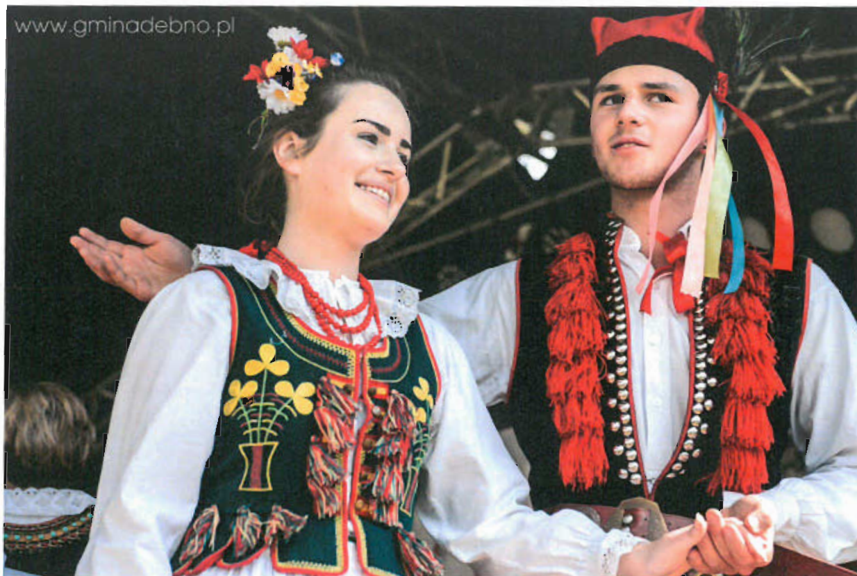
Fot. nr 11 Zespół Łoniowiacy