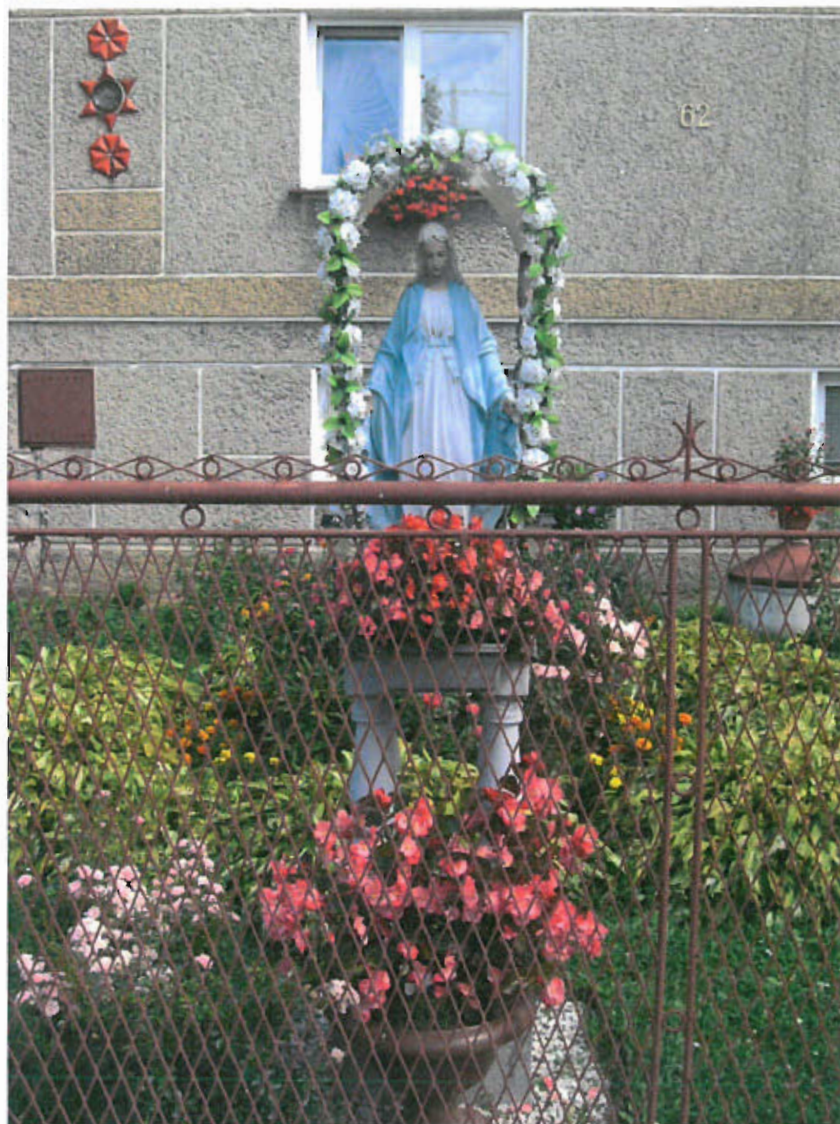
Fot. nr 7 Figura Matki Bożej, 1990 rok