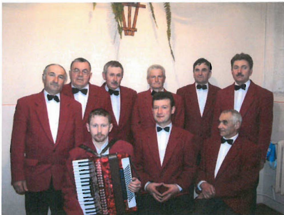
Fot. nr 18 Zespół Niedźwiedzki