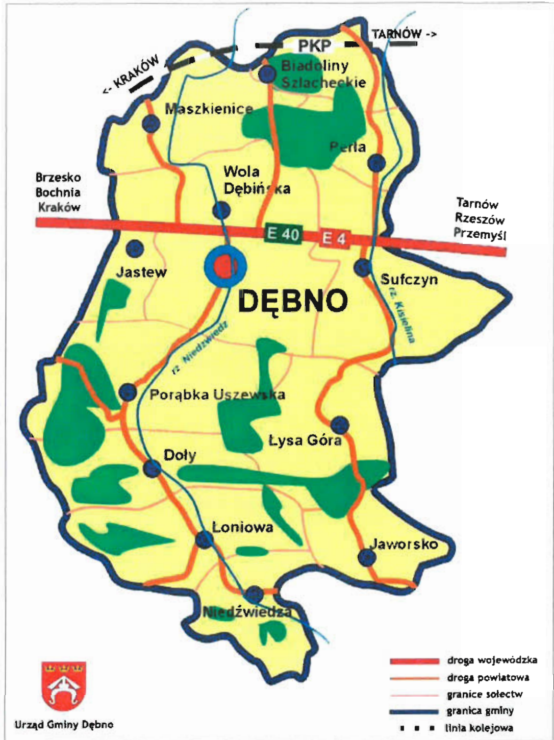
Rys. nr 2 Mapa Gminy Dębno