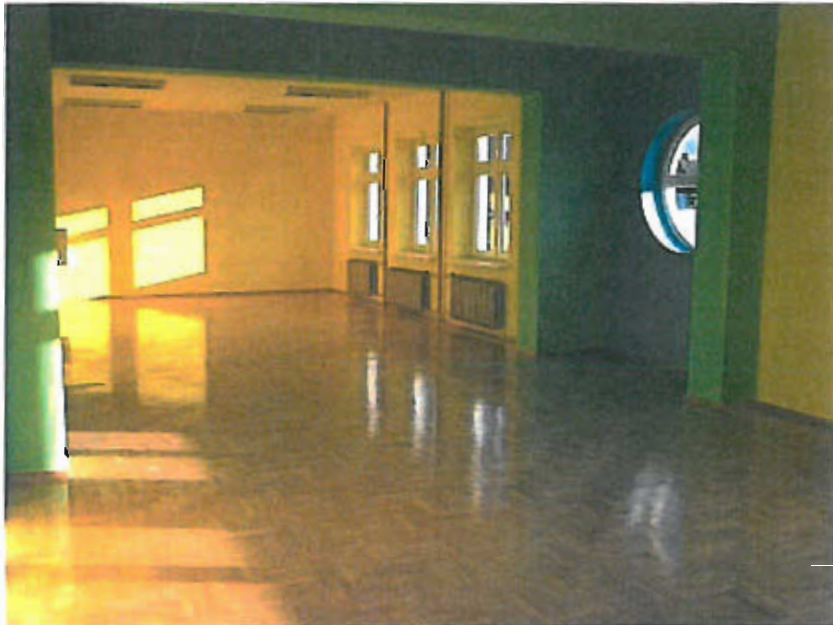
Fot. nr 10 Sala w budynku DCK