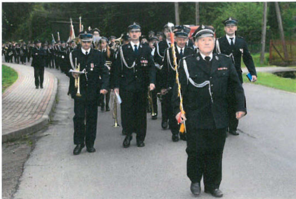
Fot. nr 13 Orkiestra Dęta OSP Łysa

regionu, edukacja kulturalna dzieci i młodzieży, promocja przez kulturę oraz rozwój czytelnictwa. DCK organizuje i koordynuje wszystkie działania kulturalne w Gminie Dębno.