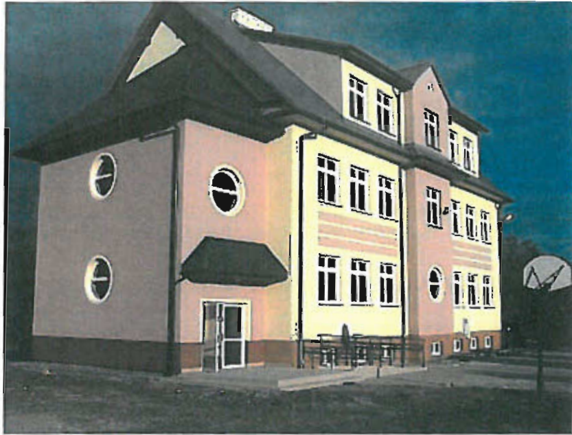
Fot. nr 9 Widok budynku DCK w miejscowości Jastew