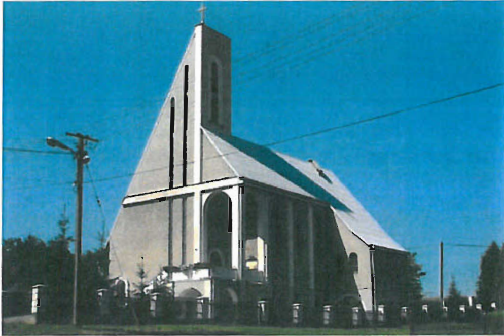
Fot. nr 19 Widok kaplicy w Jastwi

21. VII. 1991 roku Jastew przeżyła niezwykłą uroczystość a mianowicie poświęcenie kościoła najświętszego Serca Jezusowego. Na uroczystości do Jastewskiej kaplicy przybyli ks. Bp Władysław Bobowski, ks. Dziekan Czesław Konwent z Porąbki Uszewskiej i około 15 księży z dekanatu Wojnicz i ze sąsiedztwa.