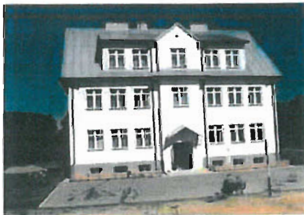
Fot. nr 20 Budynek Szkoły Podstawowej — obecnie siedziba DCK

Na terenie miejscowości Jastew do 2008 r. działała Szkoła Podstawowa, której budynek został zaadaptowany na potrzeby w Dębińskiego Centrum Kultury.