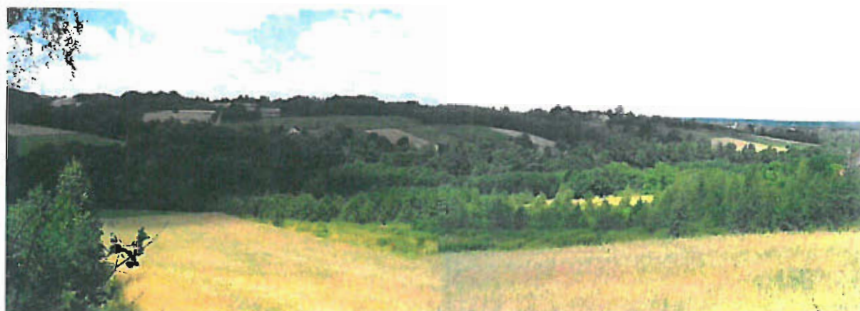
Fot. nr 1 Dolina Jastwianki — krajobraz Pogórza Wiśnickiego w części sołectwa Jastew

Rzeźba terenu jest bardzo charakterystyczna dla typu pogórza średniego - deniwelacje nie przekraczają 100 m, wzniesienia mają szerokie, płaskie wierzchowiny a stoki łagodnie opadają ku płaskodennym dolinom. Południowa część terenu charakteryzuje się najbardziej urozmaiconą rzeźbą. W jej obrębie można spotkać również wyraźniej zaakcentowane formy morfologiczne związane z działalnością wód płynących (cieków) lub wód spływających stokami w czasie intensywnych opadów. Przykładami mogą być: miejscami głęboko wcięte doliny cieków, a także niewielkie parowy rozcinające stoki wzniesień, prowadzące okresowo wodę.