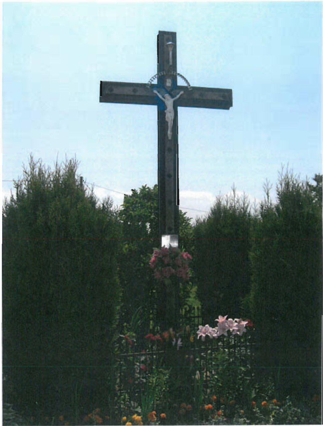
Fot. nr 4 Krzyż, 2000 rok