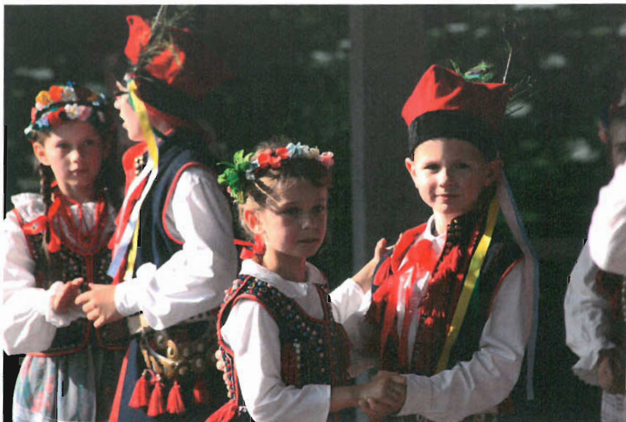
Fot. nr 16 Mali Łysogórzanie