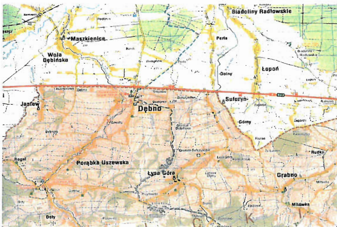
Ryc. nr 7 Fragment północnej granicy Obszaru Chronionego Krajobrazu Wschodniego Pogórza Wiśnickiego, w obrębie którego położona jest Jastew

W obrębie miejscowości Jastew Minister Środowiska w drodze decyzji uznał lasy znajdujące się w granicach działek 178 i 60 za glebochronne. Lasy tej kategorii ochronności pełnią ważną funkcję związaną z ochroną gleby przed zmywaniem lub wyjałowieniem, powstrzymują usuwanie się ziemi oraz obrywanie się skał.