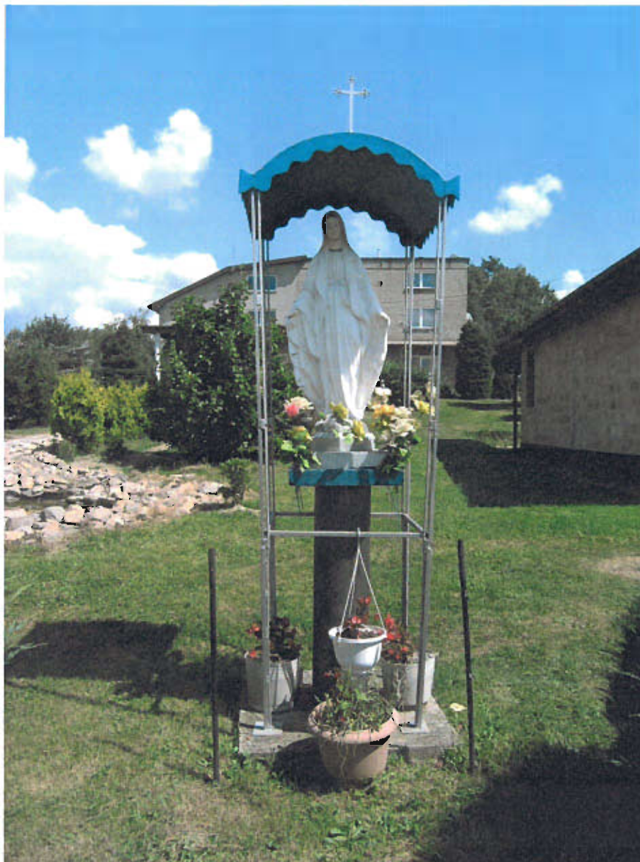
Fot. nr 8 Figura Matki Bożej, 2000 roku