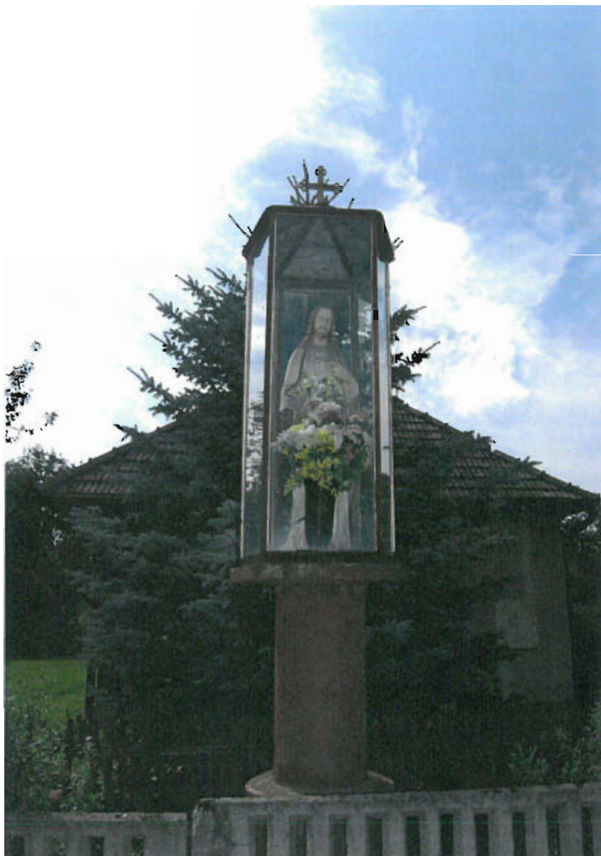
Fot. nr 7 Figura Najświętszego Serca Pana Jezusa, 1968 roku