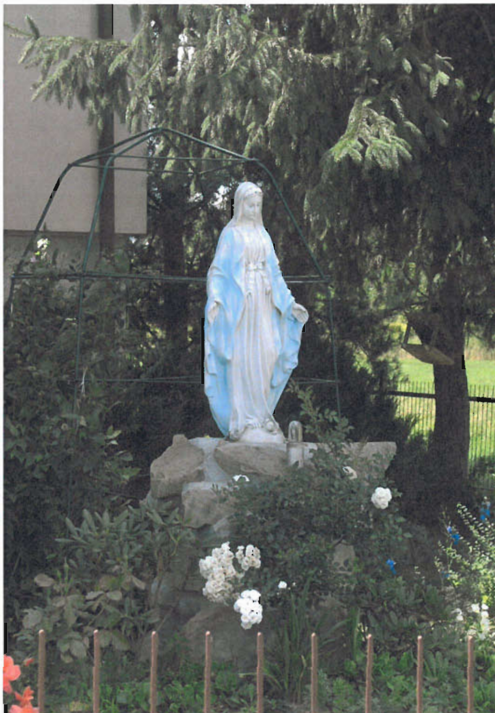
Fot. nr 6 Figura Matki Bożej, 1994 roku