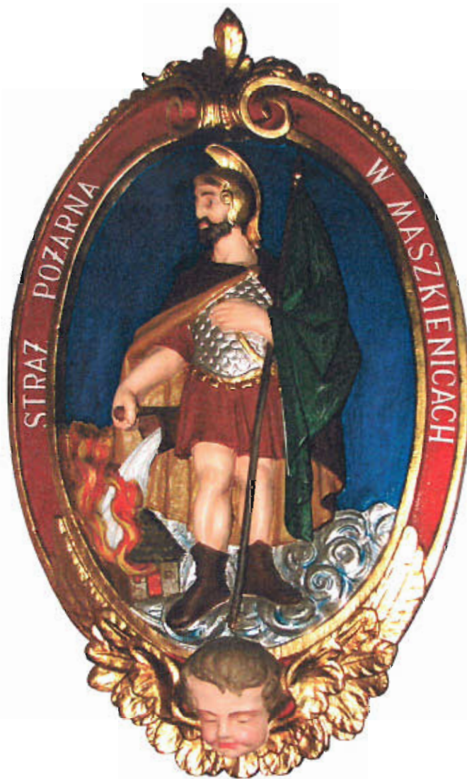
Rys. nr 4 Emblemat OSP Maszkienice

OSP Maszkienice to organizacja działająca na terenie gminy Dębno. Jest jednostką, która od 110 lat rozwija się w kierunku ochrony przeciwpożarowej. Dbamy o rozwój strażaków ochotników w zakresie ratownictwa i pożarnictwa. OSP posiada status Organizacji Pożytku Publicznego.