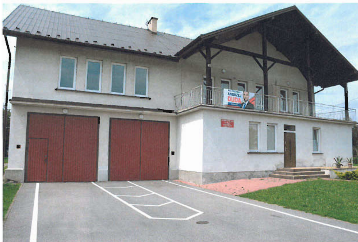
Fot nr 14 OSP w Maszkienicach