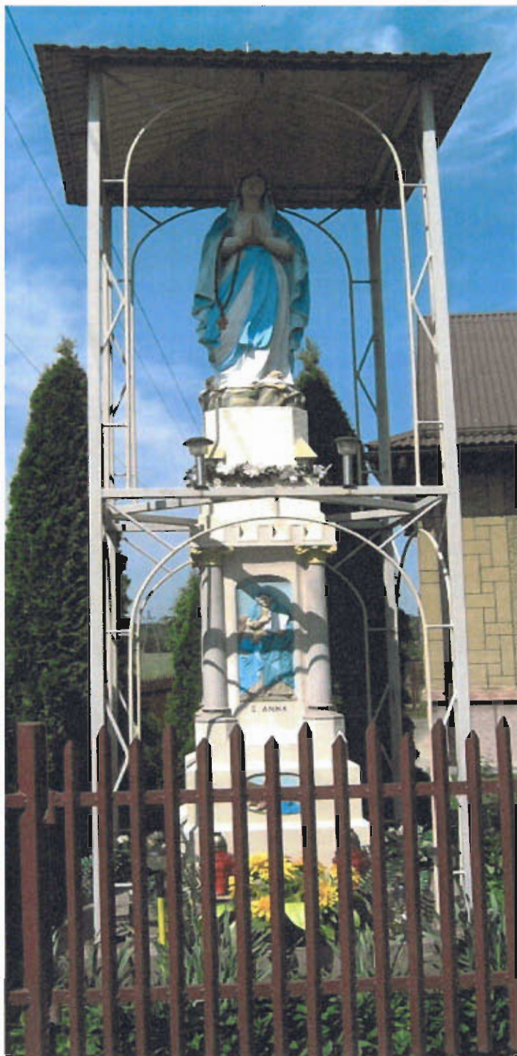
Fot. nr 10 Figura Najświętszej Marii Panny, 1890 roku, przesunięta na obecne miejsce 1970 roku