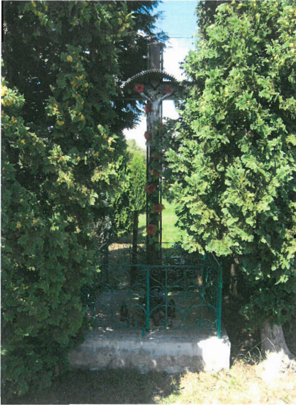
Fot. nr 11 Krzyż,