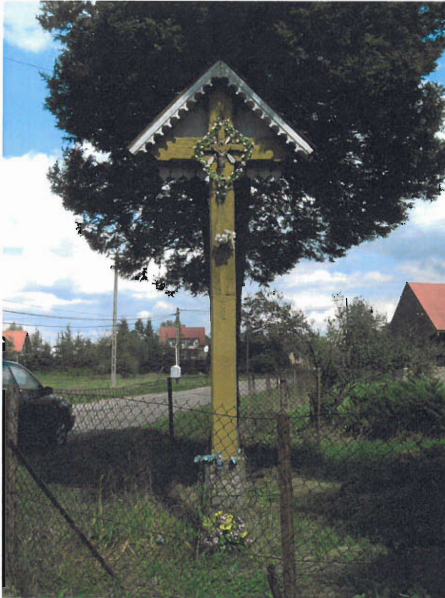
Fot. nr 12 Krzyż,