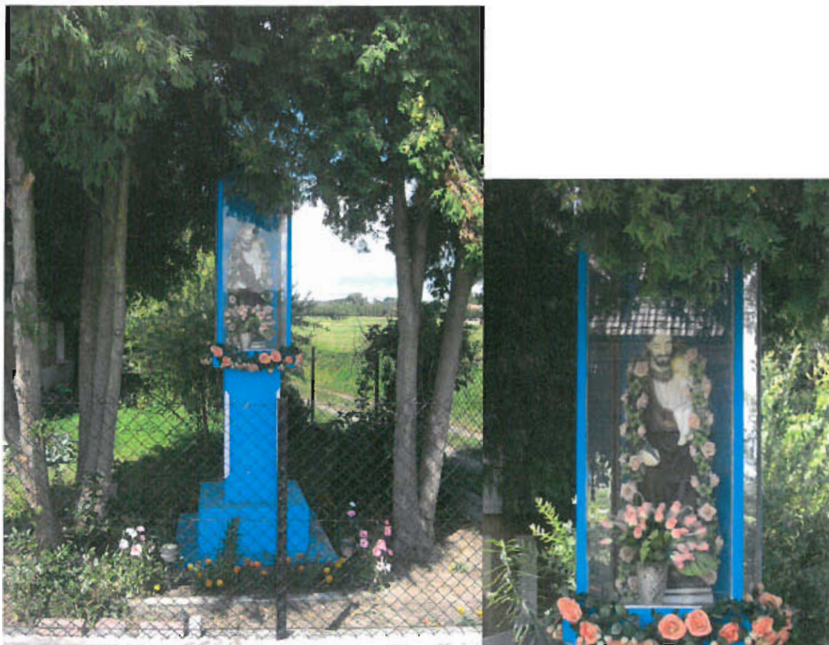
Fot. nr 9 Figura Św. Józefa z Dzieciątkiem,