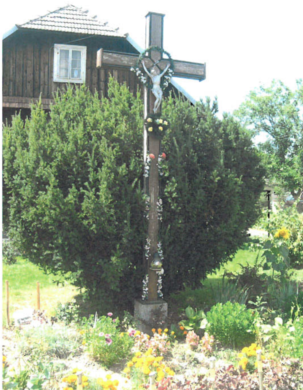
Fot. nr 4 Krzyż