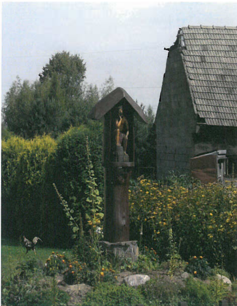
Fot. nr 13 Figura Chrystusa Frasobliwego, Obiekty i tereny, infrastruktura społeczna.