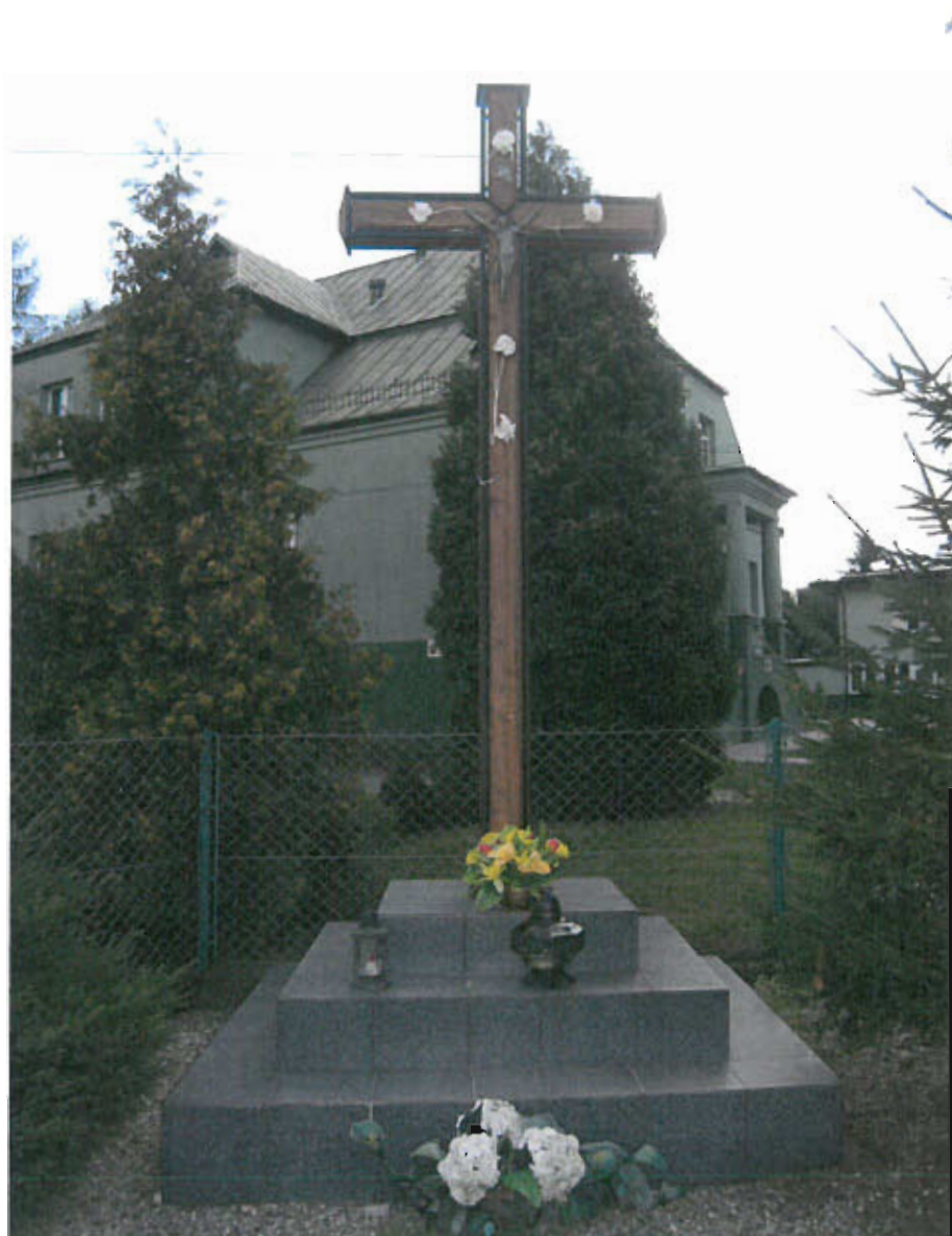
Fot. nr 5 Krzyż przy szkole podstawowej, datowanie nieznane,