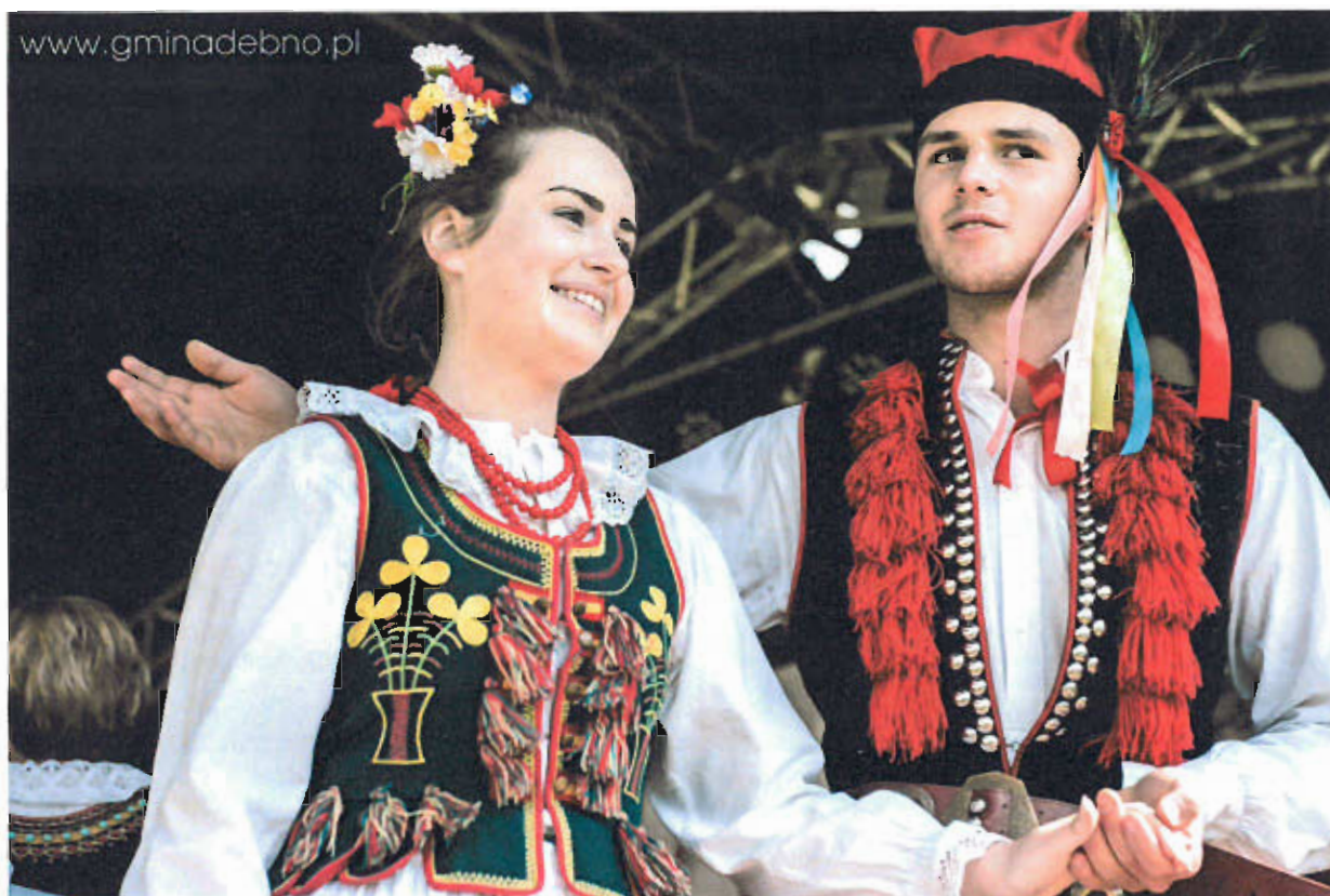
Fot. nr 11 Zespół Łoniowiacy