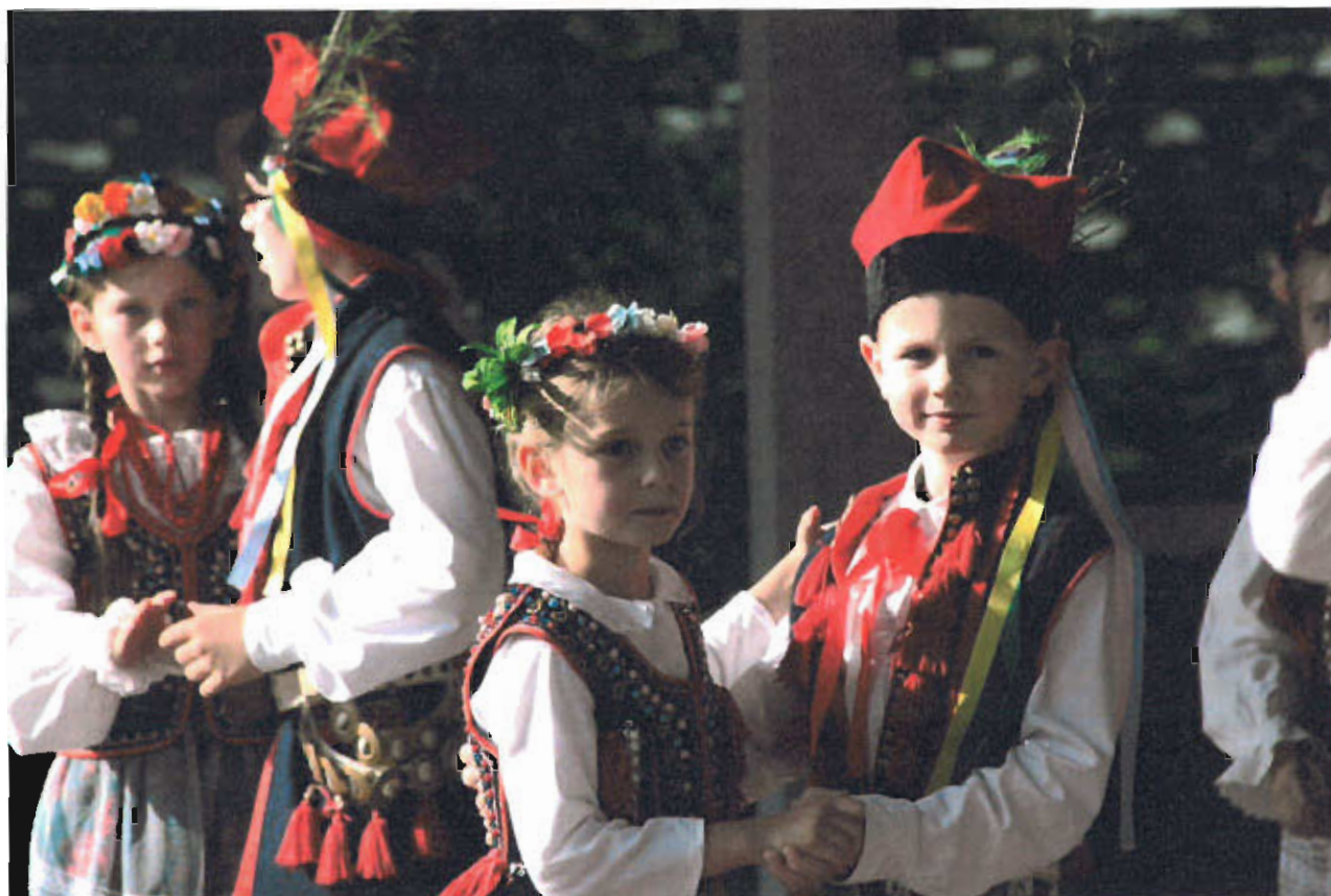
Fot. nr 16 Mali Łysogórzanie