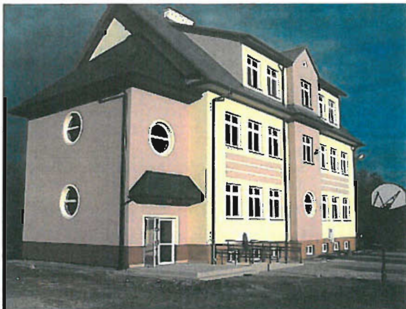
Fot. nr 9 Widok budynku DCK w miejscowości Jastew