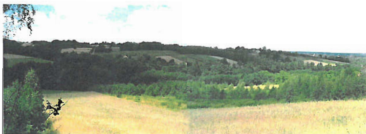
Fot. nr 1 Dolina Jastwianki — krajobraz Pogórza Wiśnickiego w części sołectwa Jastew

Rzeźba terenu jest bardzo charakterystyczna dla typu pogórza średniego - deniwelacje nie przekraczają 100 m, wzniesienia mają szerokie, płaskie wierzchowiny a stoki łagodnie opadają ku płaskodennym dolinom. Południowa część terenu charakteryzuje się najbardziej urozmaiconą rzeźbą. W jej obrębie można spotkać również wyraźniej zaakcentowane formy morfologiczne związane z działalnością wód płynących (cieków) lub wód spływających stokami w czasie intensywnych opadów. Przykładami mogą być: miejscami głęboko wcięte doliny cieków, a także niewielkie parowy rozcinające stoki wzniesień, prowadzące okresowo wodę.