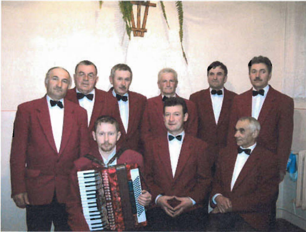
Fot. nr 18 Zespół Niedźwiedzoki