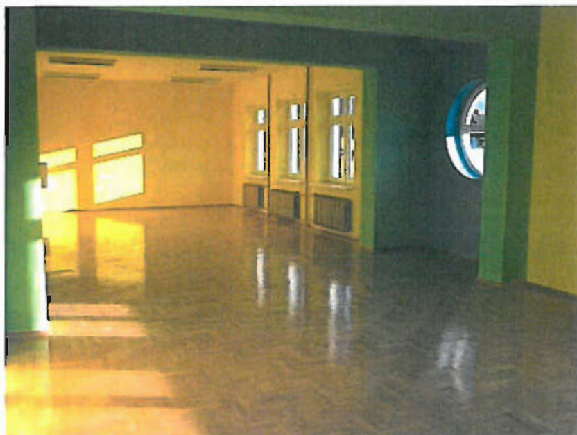
Fot. nr 10 Sala w budynku DCK