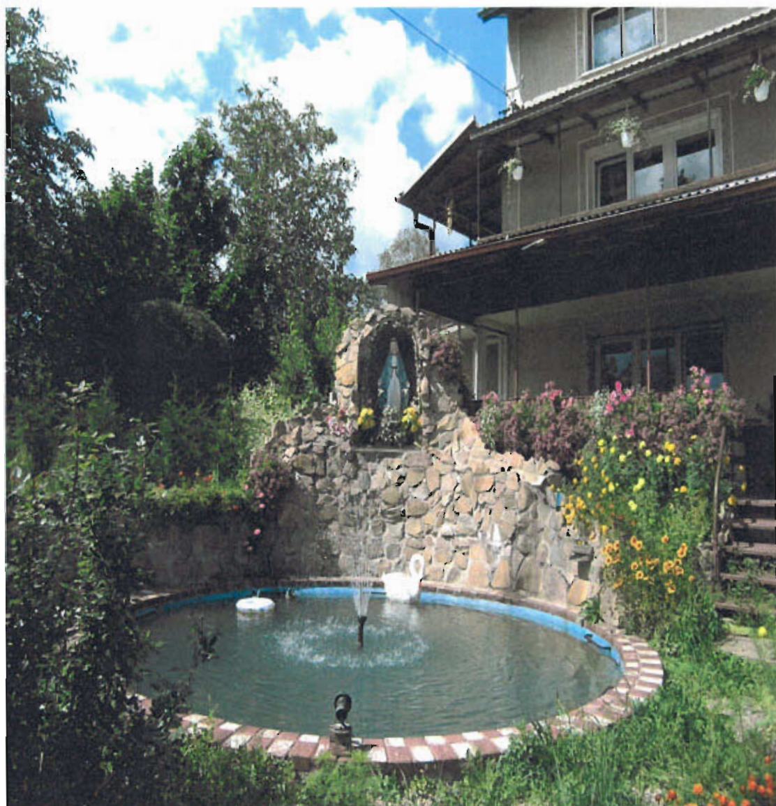
Fot. nr 6 Figura Matki Bożej, Grota Lourdes, 1999 rok