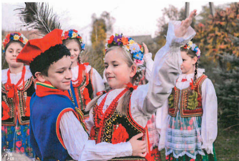
Fot. nr 15 Mali Łoniowiaci

zdobywali nagrody, m.in. „Krakowski Wianek” podczas Przeglądu Regionalnych Zespołów Ludowych w Szczurowej. Próby zespołu odbywają się w Łoniowej. Uczestniczy w nich około 40 osób, wśród których obok mieszkańców Łoniowej są także mieszkańcy Jaworska, Łysej Góry, Dębna, Woli Dębińskiej, Dołów i Porąbki Uszewskiej.