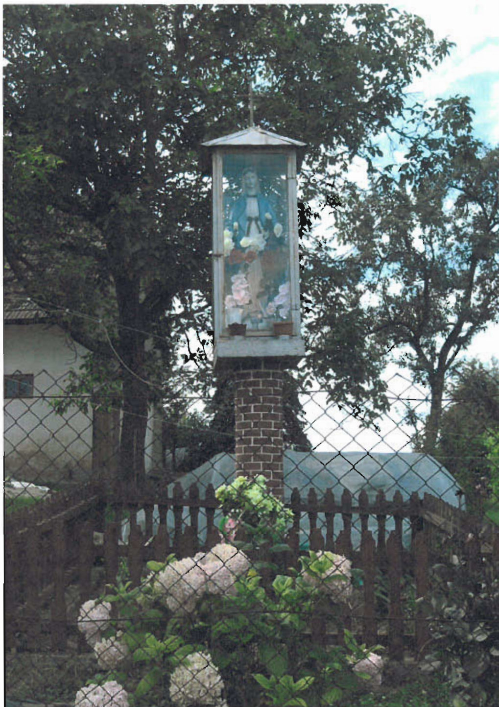
Fot. nr 8 Figura Matki Bożej, 2000 rok