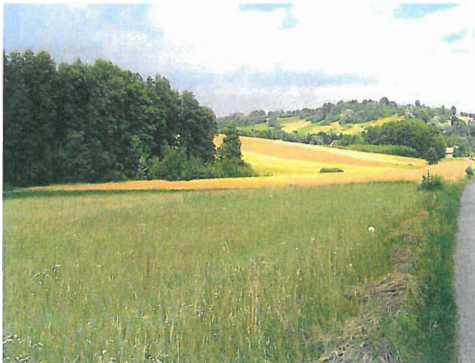
Fot. nr 2 Krajobraz wschodniej części sołectwa Jastew — wzniesienia o łagodnych stokach i spłaszczonych wierzchowinach.

Zachodnia krawędź wzniesienia jest bardziej stroma — tworzy ją wyraźny próg przechodzący w dno doliny rzeki Jastwianki. Wierzchowina wzniesienia jest płaska, jego kulminacja znajduje się poza opracowywanym terenem. Wschodnie wzniesienie ma podobny charakter.