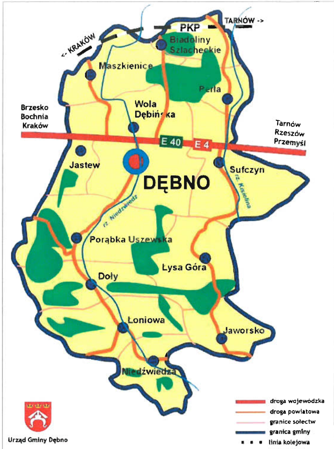
Rys. nr 2 Mapa Gminy Dębno