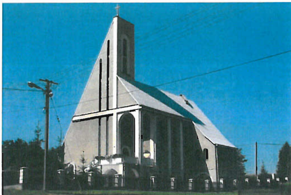
Fot. nr 19 Widok kaplicy w Jastwi

21. VII. 1991 roku Jastew przeżyła niezwykłą uroczystość a mianowicie poświęcenie kościoła najświętszego Serca Jezusowego. Na uroczystości do Jastewskiej kaplicy przybyli ks. Bp Władysław Bobowski, ks. Dziekan Czesław Konwent z Porąbki Uszewskiej i około 15 księży z dekanatu Wojnicz i ze sąsiedztwa.