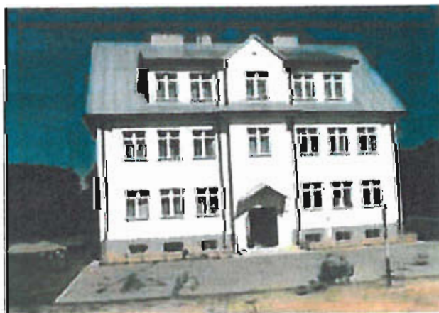
Fot. nr 20 Budynek Szkoły Podstawowej — obecnie siedziba DCK

Na terenie miejscowości Jastew do 2008 r. działała Szkoła Podstawowa, której budynek został zaadaptowany na potrzeby w Dębińskiego Centrum Kultury.