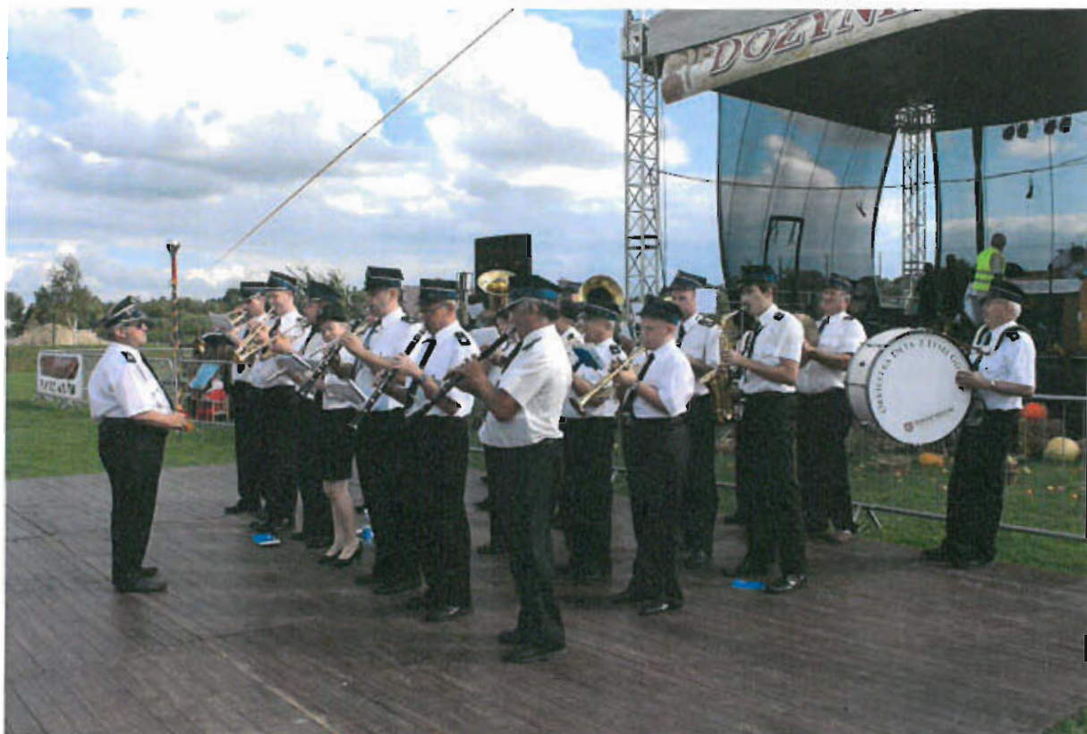
Fot. nr 12 Orkiestra Dęta OSP z Łysej Góry

nastąpiła fuzja orkiestry z miejscową strażą pożarną, z tego też powodu pojawiła się nowa nazwa: Orkiestra Dęta OSP w Łysej Górze .