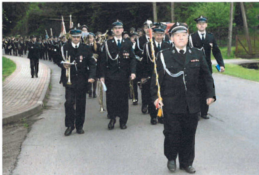
Fot. nr 13 Orkiestra Dęta OSP Łysa

regionu, edukacja kulturalna dzieci i młodzieży, promocja przez kulturę oraz rozwój czytelnictwa. DCK organizuje i koordynuje wszystkie działania kulturalne w Gminie Dębno.