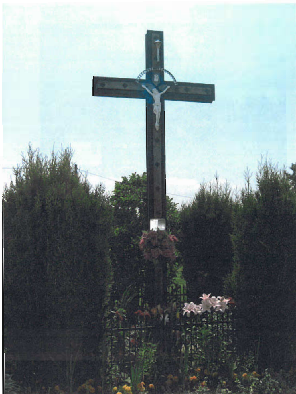
Fot. nr 4 Krzyż, 2000 rok