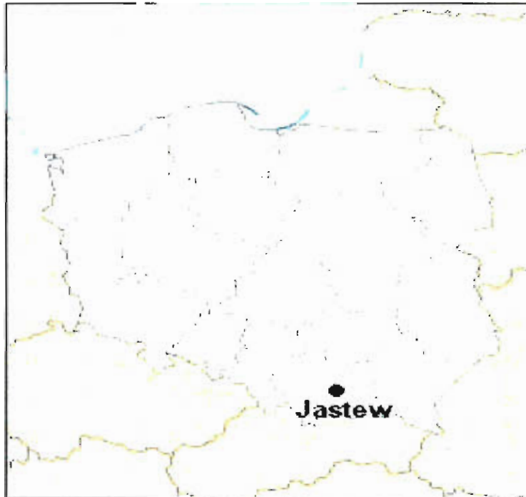
Rys. nr 1 Położenie miejscowości Jastew na mapie Polski

Wieś Jastew to jedno z trzynastu sołectw Gminy Dębno. Wieś położona jest w województwie małopolskim, powiecie brzeskim, w gminie Dębno.