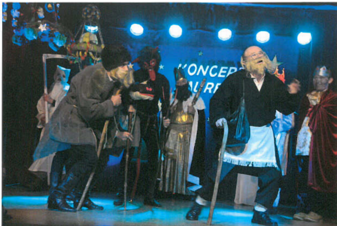
Fot. nr 17 Zespół Mszkieniczanie