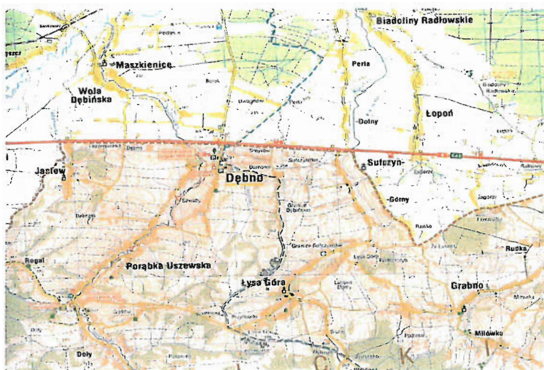
Ryc. nr 7 Fragment północnej granicy Obszaru Chronionego Krajobrazu Wschodniego Pogórza Wiśnickiego, w obrębie którego położona jest Jastew

W obrębie miejscowości Jastew Minister Środowiska w drodze decyzji uznał lasy znajdujące się w granicach działek 178 i 60 za glebochronne. Lasy tej kategorii ochronności pełnią ważną funkcję związaną z ochroną gleby przed zmywaniem lub wyjałowieniem, powstrzymują usuwanie się ziemi oraz obrywanie się skał.